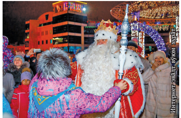
Интернет эвӑлт вӱлом хураґ

Хӑлум хӑтл мӑр, щит ван хатлуп тыдӑщ 7-мит хӑтл вӱш эвӑлт 9-мит хӑтл вӑнты Ёмвошн Ищки икет, Доньщӑн эвет па па моньщӑн ӗх кӱтӑдн кӑссӑт. Щиты мойн ӗх 30 ӗмӑщ кӑсупсы ванлтӑсӑт. Дыв пелӑда Россия па Белоруссия мӱвӑнн культура заслуженной рӑпатнекӑт па Ёмвошӑн 1-мит па 3-мит ӑшколайӑнӑн вӑндтыйлты нявремӑт тӑса нух вантсӑт. 8-мит хӑтлӑн «Югра-Классик» немуп якты-ариты хотн мойн ӗх хурамӑна арисӑт, яксӑт, ӗмӑщ етнхотӑт альсӑт. 9-митн Борис Лосев немпи парк хуца «Ай да валенки!» немпи кӑсупсы вӑс, вошӑн ӗх