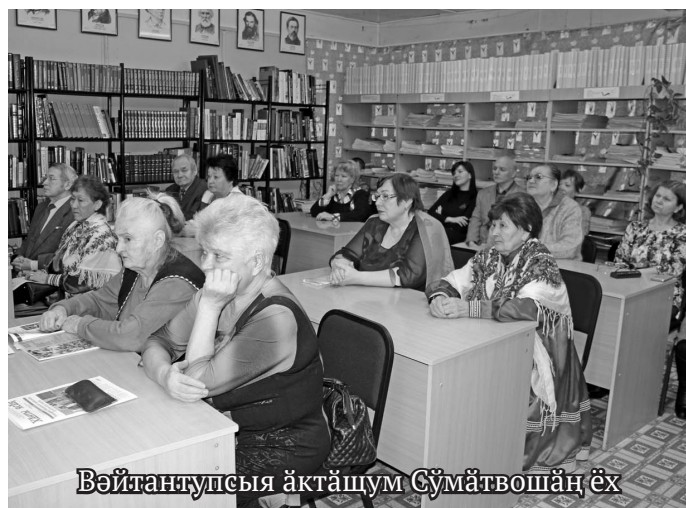
Вәйтантиулсыя әктәшум Сүмәтвошәң әх

па вәнтәтн сыр-сыр вәнт войт вәлдәт. Тәп щитәвн Сүмәтвош районәв округев арсыр вошәт па районәт эвәлт еша па хурпия лұңтәсл.