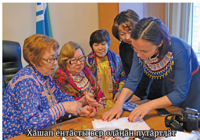
Хәшап әнтәсты вер оләңән путәртләт