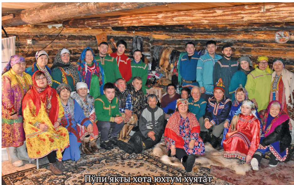
Пүпи якты хотә юхтум хуятәт