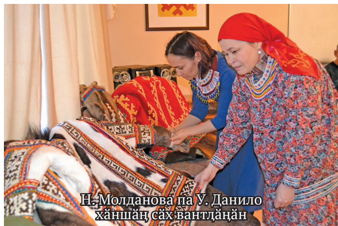
Н. Молданова па У. Данило хәншәң сәх вантләңән