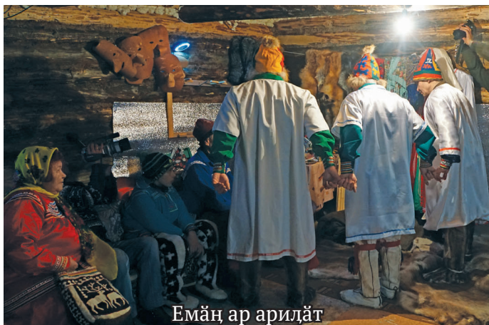
Емәң ар ариләт