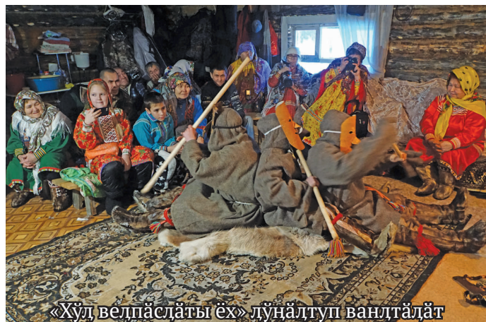
«Хүд велпәсләты ёх» дүңәлтуп ванлтәләт

50 од мәнәс ши вүш эвәлт, хән юхи хәшум артән Сәрханл районән Сытомино көрт пүңәлн Пүпи якты хот верәнтсы. Щит Дарко-Горшково көртән вәс, ин тәм көртән немхуят па ән вәд. Вәндата ювум хуятәт ши хәтл яма нәмләд: хәнты арәт, хурамәң якәт.