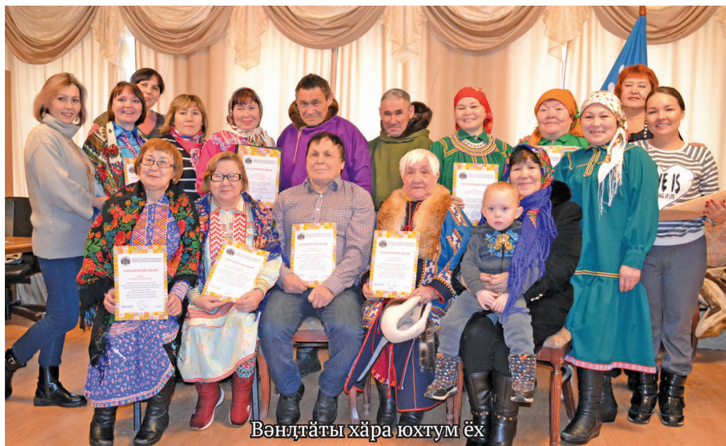
Вәндтәты хәра юхтум ёх