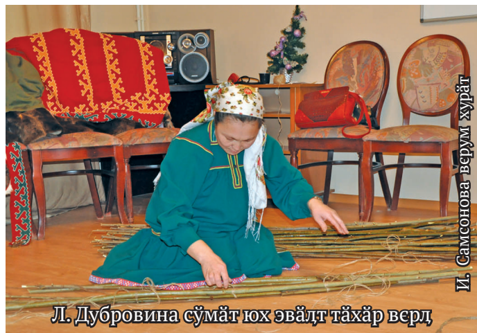
Л. Дубровина сүмәт юх эвәлт тәхәр верл