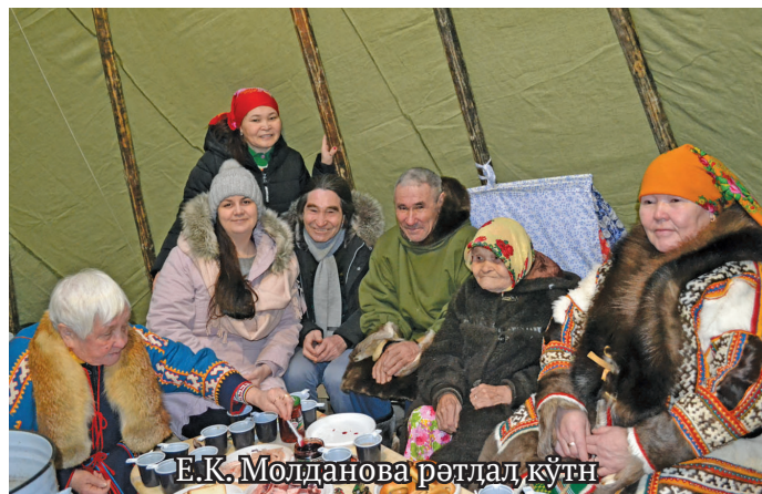
Е.К. Молданова рәтләл кўтн

Тәд па ищки нюки хота муй щирн лунемәты рәхл? Айлат хәнты не Ульяна Алексеевна тәм од грант нәтупсы вух мушәтум юпийн кимит вәндтәты хәра әктәщты питәс. Вәйтәнтупсы «Нюки хот дыпийн вәдты пурмәсәт» немпунсәлә. Лўв лупәс: