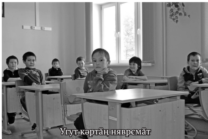
Угут кӗртӗн нывремӗт