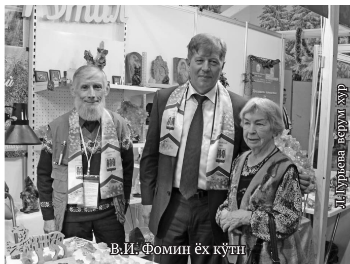
В.И. Фомин ёх күтн

Кашаң ол мўн районэва ар мойң ёх юхтыйллат. Дывела Кев хуща яңхты мостэд.