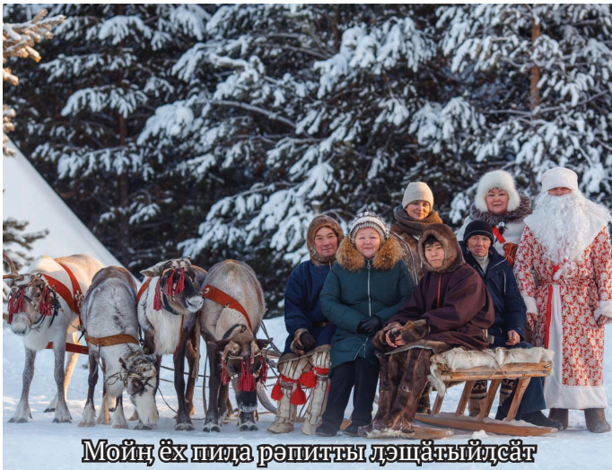
Мойң ҕх пида рэпитчы дэщятыдсәт