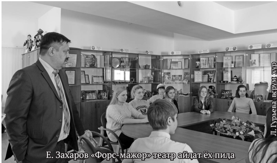
Е. Захаров «Форс-мажор» театр айдаг эх пида