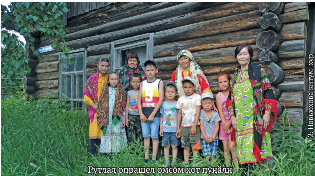
Рутдал опращел омсом хот пўңәдн