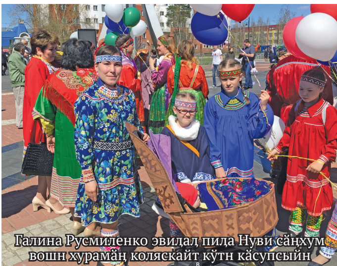
Галина Русмиленко эвидал пида Нуви сәнхум вошн хурамәң коляскайт күтн кәсупсәйин