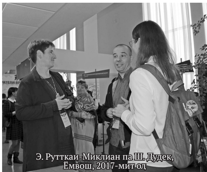
Э. Рутткаи-Миклиан па Ш. Дудек, Ёмвош, 2017-мит ол