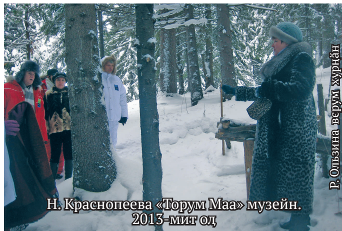
Н. Краснопеева «Торум Маа» музейн. 2013-мит ол