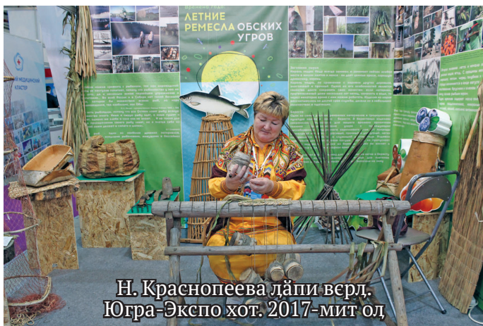
Н. Краснопеева лапи верл. Югра-Экспо хот. 2017-мит ол