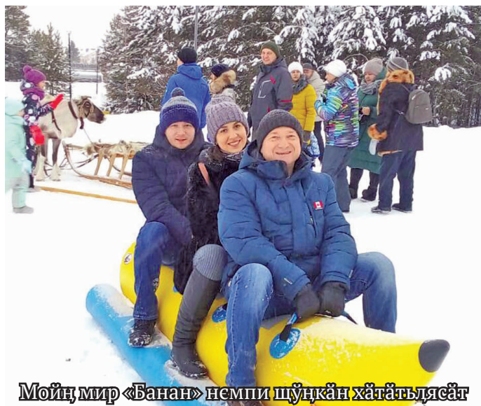
Мойң мир «Банан» немпи шүңкән хәтәтәлдәсәт

дәщятсәт. Ищки ики ищи мойң хуятат пида вәйтантылдәс. Кәрта юхтум хәннехуятат нюхрум потум няр нюхийн па хұдн дапәтсыйт, щәлта дыв