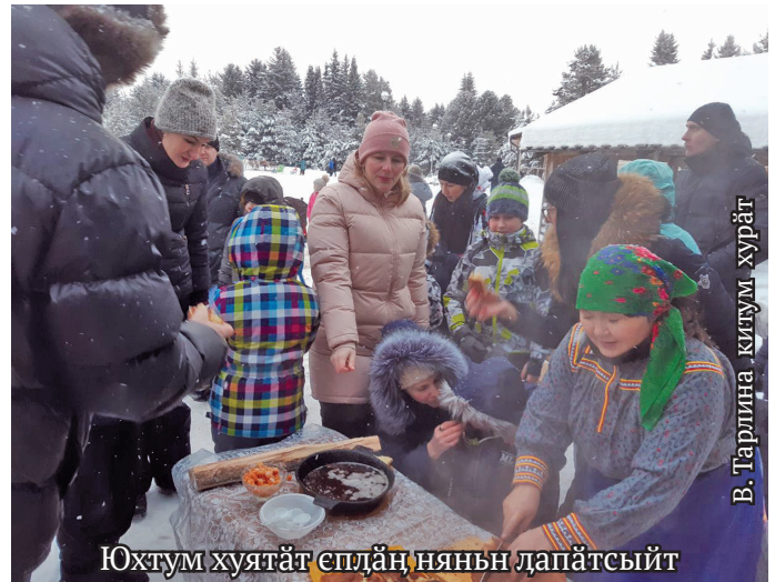
Юхтум хуятат епләң няньн дапәтсыйт