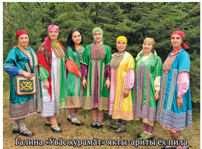
Галина «Увас хурамат» якты-ариты ех пида

шәң хуятата пуртәнәт лоньщтәлүм, дывәт пелды вантлүм, муй мосд дыведа, нәтлүм. Итәх пурайн ат мәр рәпитлүм. Ин рәпатаем мосман тәйтлем. Ма пидама ям неңәт рәпитләт. Айлат эвет тыв рәпитты юхәтләт, ма дыведа иса нәтлүм. Ма вәдем, айлат хуятата олаңмит пурайн давәрт рәпитты, дыведа нәтты мосд па иса верәта вәндтәты. Еша рәпитләт па ищиты иса верәт вәты питләт. Ма щиремн, кашәң рәпатайн щиты вәд. Ма айдата вәлмемн тәта итәх неңәт ма пидама щиты путәртсәт, хуты ма иса вәдем па ар од мәр щиты рәпитсум. Щирн давәрта вәс».